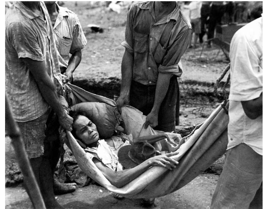
Chamorro-Frau von der Insel Guam 1944 nach der Befreiung von japanischer Besatzung.

Die Tatsache, dass keine breite gesellschaftliche und kritische Auseinandersetzung mit dem Kolonialismus stattfindet, führt dazu, dass in unseren Köpfen koloniale Denkweisen immer noch ihr Unwesen treiben. Auch dies ist Thema der Veranstaltung.