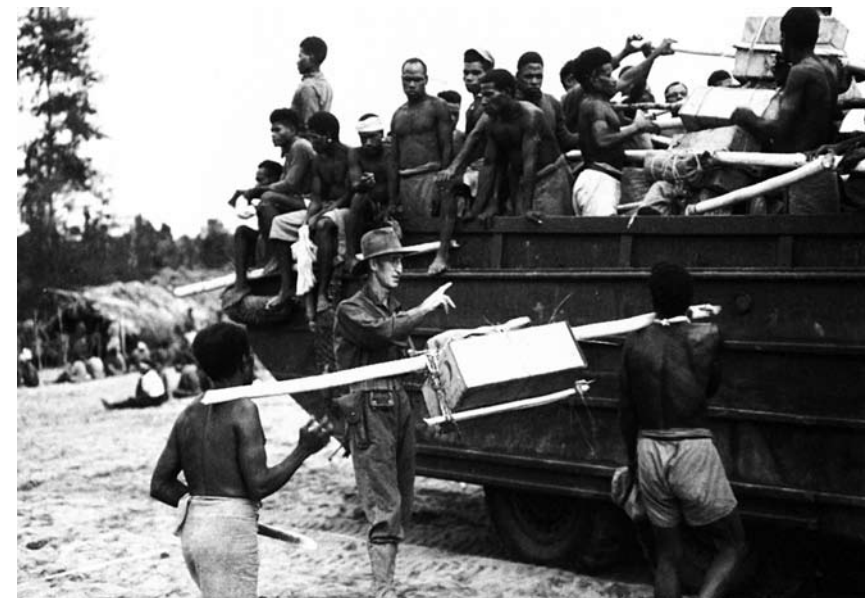
Auf Befehl weißer Offiziere müssen die Insulaner alles, was die kriegführenden Armeen brauchen, über glitschige Pfade ins umkämpfte Gebirge Neuguineas schleppen (Aitape, Papua-Neuguinea, August 1944).