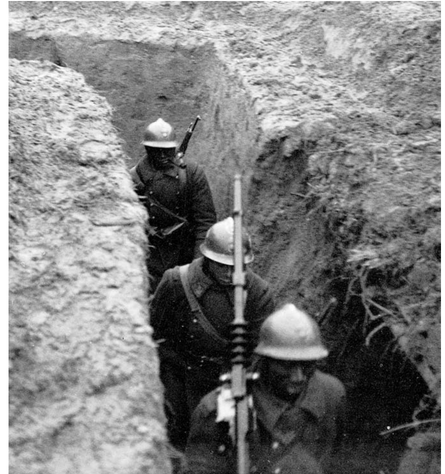
Afrikanische Kolonialsoldaten 1939 in einem französischen Schützengraben.

An Hörstationen sind die Erinnerungen ausgewählter ZeitzeugInnen über Kopfhörer im Originalton mit deutscher Overvoice zu hören. Auf Videoscreens können filmische Dokumente verfolgt werden.