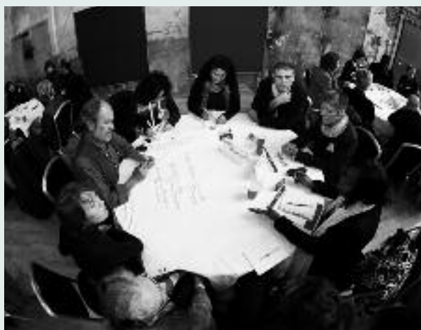
Teilnehmende des Fachforums 4