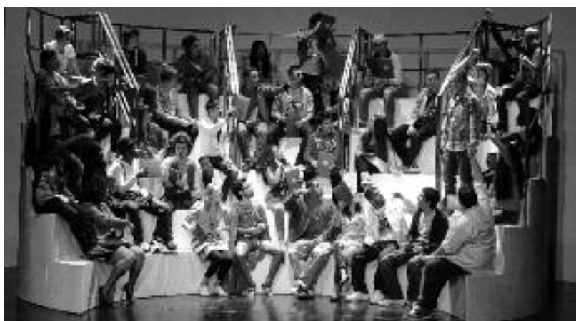
Szene aus dem Theaterstück „Next Generation“

Und dann erlebt das Publikum, was sich im multikulturellen Ruhrgebiet abspielt. 37 junge Leute agieren auf der Bühne. Sie erzählen ihre Geschichten und die ihrer Familien, sie beschreiben ihre gegenwärtige Situation und werfen einen Blick in die Zukunft. Laute Rap-Songs gehören ebenso dazu wie Tanzeinlagen, Videoclips oder nachdenkliche Monologe. Immer wiederkehrendes Leitmotiv sind die Fragen: Wie heißt du? Woher kommst du? Was ist dein Traum? Ein Fazit dazu lautet: Es geht darum, wohin wir gehen, nicht, woher wir kommen. Und am Schluss ertönt, an einen Chor im klassischen Drama erinnernd, ein Loblied auf das Ruhrgebiet: „Metropole: Nein, danke! – Hier ist jede Stadt anders. Sie haben keine Gemeinsamkeiten. Hier bin ich zu Hause! Hier sind meine Freunde! Hier ist alles, was mir wichtig ist! Hier ist man den Kulturen ‚fremd – nah‘.“