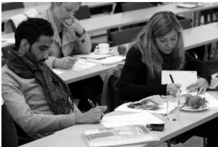
Teilnehmende des Fachforums 3

Zur Förderung der Kreativbranche ist außerdem ein Qualifizierungsangebot notwendig, das zusätzliche Kompetenzen, etwa betriebswirtschaftliche Kenntnisse, vermittelt. Nicht zuletzt sollten die Schnittstellen zwischen Institutionen und Freien, zum Beispiel Theater und Medien, effektiver genutzt werden.