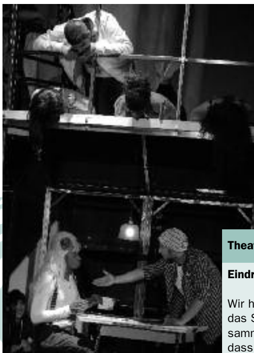
Szene aus dem Theaterstück "Next Generation"

Ich bin hier geboren, hier will ich sterben. Ich will hier nicht weg, ich will Präsident werden.