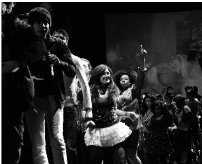
Szene aus dem Theaterstück „Next Generation“

che und über die ihrer Stadt und der Region. Meistens sind es nur Erwachsene, die ihre Ideen und Pläne zum Strukturwandel, zur Stadtentwicklung und zu Zukunftsperspektiven einbringen können. Aber es ist wichtig, die junge Generation einzubeziehen, die ja in dieser Zukunft leben wird. Eigentlich müssten die Jugendlichen mitentscheiden, aber zumindest sollten sie die Gelegenheit haben, zu sagen, wie sie in Zukunft leben wollen. Diese Möglichkeit boten die Zukunftshäuser. Den Jugendlichen wurden Räume und Infrastruktur zur Verfügung gestellt. Unterstützung erhielten sie außerdem, je nach Zukunftshaus und Projekt, durch Künstler und Wissenschaftler. Wir haben bei den Zukunftshäusern bewusst vorhandene Strukturen aufgegriffen, zum Beispiel den Medienbunker, Renegade oder X-Vision. Denn Next Generation soll dazu beitragen, dass ihre Arbeit über das Jahr 2010 hinaus gestärkt wird und dass sie mehr junge Leute erreichen.