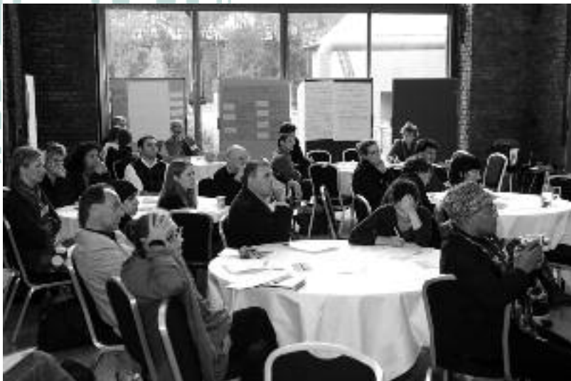
Teilnehmende des Fachforums 4

Ein Teilnehmer aus dem Publikum merkte an, dass ein wissenschaftlicher Zugang als Vorstufe zur Praxis nötig sei.