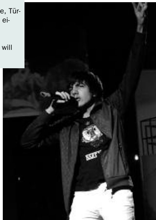
Szene aus dem Theaterstück "Next Generation"