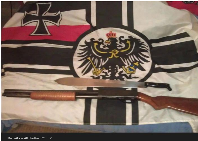
Misanthropic Division: Anhänger der Gruppe präsentieren bei VK ihre Waffen. (Quelle: vk.com; Original unverpixelt)

Auch die Misanthropic Division verbreitet ihre militante und menschenverachtende Propaganda auf der Plattform. Höhnisch kommentierte Bilder von KZ-Gedenkstättenbesuchen oder antisemitische Memes werden dort eingestellt und die Links dann über populäre Social-Media-Angebote einem breiten Userkreis zugänglich gemacht.