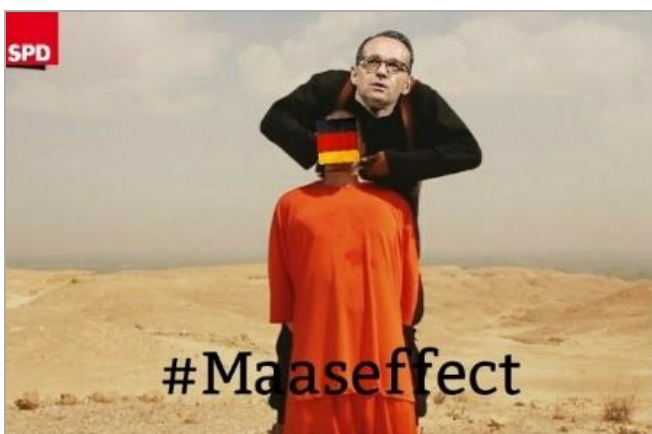
Provokante Memes: Ausschnitt aus islamistischem Hinrichtungsvideo wird als demokratiefeindliche Collage in Debatten eingespeist. (Quelle: Twitter, Original unverpixelt)

Gerade bei Twitter werden – nicht zuletzt aufgrund der beschränkten Zeichenzahl in Posts – Bilder und szenetypische Memes als verdichtete Inhalte verbreitet. Hierbei dienen sowohl grafische Darstellungen, die wie der Comic-Frosch "Pepe" der Internetkultur entspringen, als auch populäre Filme und Serien als Grundlage. Aber auch ikonografische Bilder des Zeitgeschehens werden umgestaltet, so dass sie zur Verbreitung der eigenen Propaganda genutzt werden können.