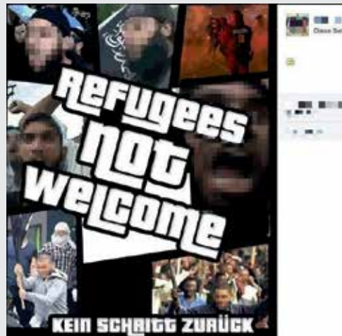
Jugendliche Popkultur als Stilmittel: Im Design des bei Jugendlichen sehr beliebten Computerspiels Grand Theft Auto (GTA) wird mit diesem Meme gegen Geflüchtete gehetzt.

Um ihre Botschaften zu verbreiten, bedient sich die rechtsextreme Szene auch einer sehr effektiven Guerilla-Taktik: Sie kapert populäre Hashtags, instrumentalisiert sie für die eigenen Zwecke und klinkt sich so mit rechtsextremen Inhalten in aktuelle Debatten ein. Ein prominentes Beispiel dafür ist der Hashtag #schauhin. Ursprünglich empörte sich unter diesem Slogan die Netzgemeinde über rassistische Vorfälle.