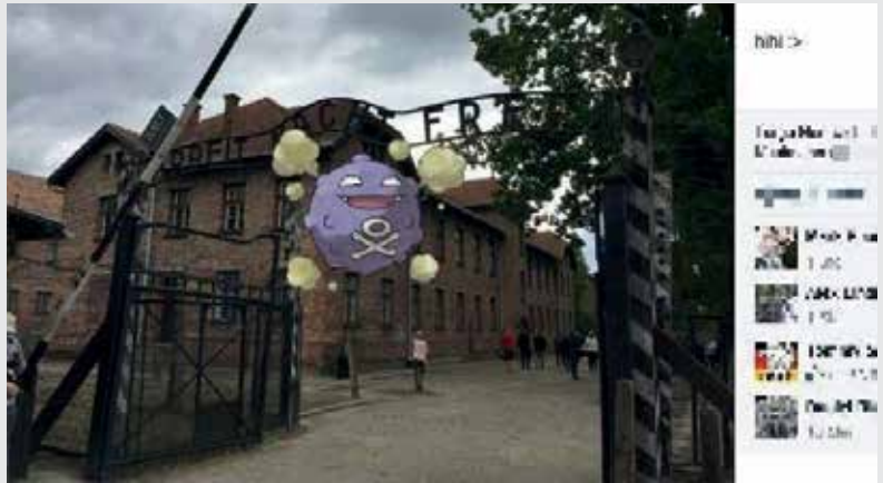
Rechtsextreme Propaganda knüpft an jugendliche Lebenswelten an: Dieses Pokémon verbreitet zum Angriff Gaswolken. Platziert vor dem Eingangstor des Konzentrationslagers Auschwitz wird der Massenmord ins Lächerliche gezogen.

Dieser Trend setzt sich bei Gruppierungen wie der rechtsextremen „Identitären Bewegung“ fort. Um Jugendliche zu ködern, nutzt sie geglättete Botschaften und unverdächtige Begriffe, inszeniert kleine und provokative Aktionen für das Internet und setzt dabei vor allem auf durchgestylte Optik. Einige wenige Aktivistinnen und Aktivisten können so mit gut geschnittenen, provokant gestalteten Videoclips Millionen User erreichen. Die Aktionen richten sich nicht mehr an unmittelbar Beteiligte, sondern sind maßgeschneidert für ein junges Onlinepublikum.