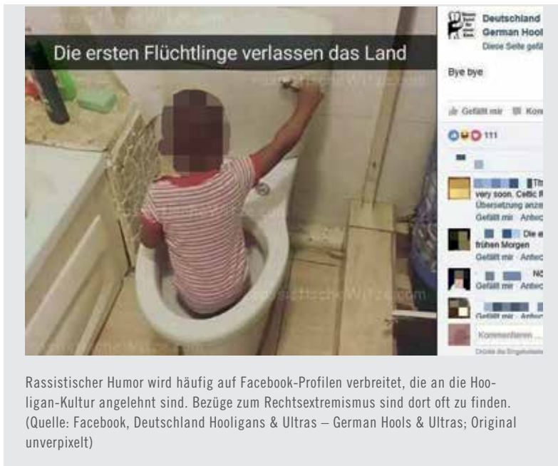
Rassistischer Humor wird häufig auf Facebook-Profilen verbreitet, die an die Hooligan-Kultur angelehnt sind. Bezüge zum Rechtsextremismus sind dort oft zu finden.