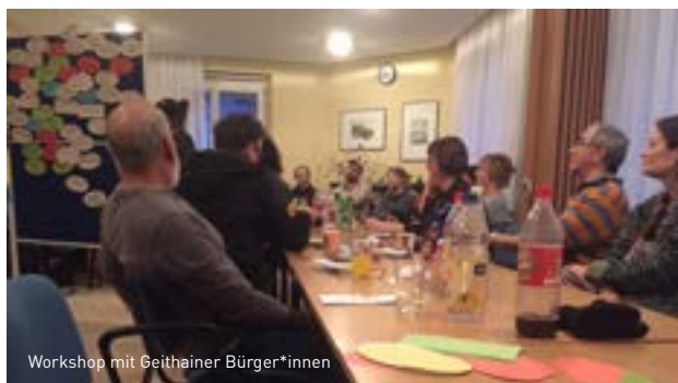
Workshop mit Geithainer Bürger*innen