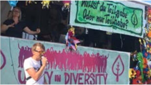
Unser Redebeitrag bei der Tolerade

Am 12.05.2018 fand in Dresden die mittlerweile 4. Tolerade statt, an welcher sich ca. 10.000 Menschen beteiligten. Die Tolerade tritt für ein friedliches, respektvolles und offenes Zusammenleben ein und positioniert sich gegen Rassismus, Homophobie, Sexismus und andere Diskriminierungsformen. Sie wurde von Dresdner Klubbetreiber*innen, Soundsystemen und Technokollektiven gegründet. Das Kulturbüro Sachsen e.V. war zum wiederholten Male mit einem eigenen Redebeitrag auf der Veranstaltung vertreten.