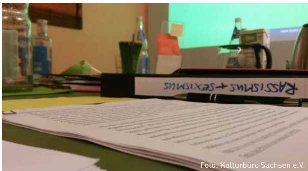
Impression vom Workshop

Im Jahr 2016 bildete die Entwicklung und Durchführung neuer Fortbildungsformate in Sachsen einen Schwerpunkt der Arbeit des Kulturbüro Sachsen e.V. Eine Förderzusage von der Bundeszentrale für politische Bildung ermöglichte es uns, diese Aufgabe im März 2016 professionell und strukturiert anzugehen. Im Frühjahr starteten wir Gespräche mit Kooperationspartner*innen und Experten diverser Themenfelder, trafen Zielvereinbarungen und entwickelten erste Workshopkonzepte. Die Erfahrungen der letzten Monate und Jahre hatte gezeigt, dass Workshopformate zu einigen aktuell diskutierten Themen fehlten.