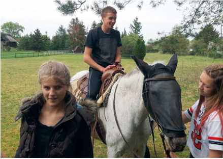
Bilder: Richard Wüllner